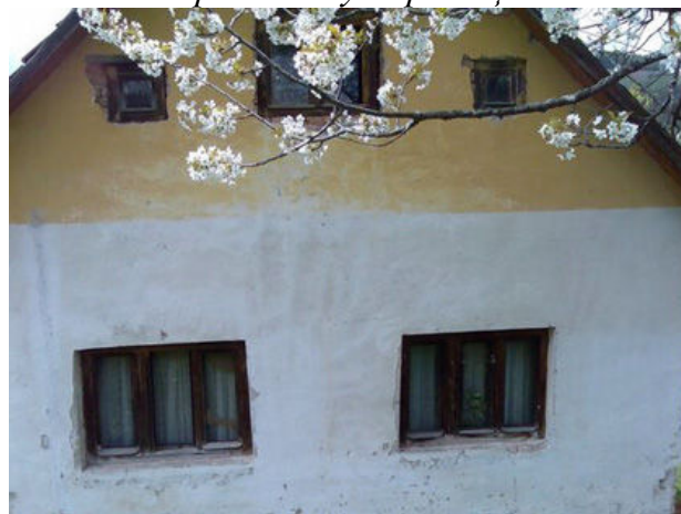
Породична кућа у Пријепољу