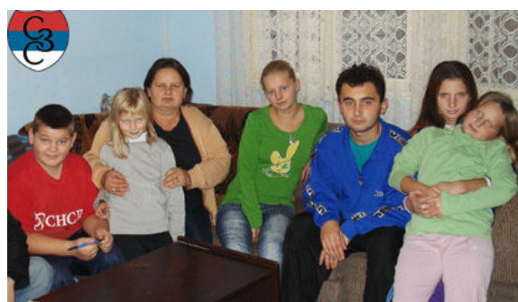
Породица Петковић, Бањалука