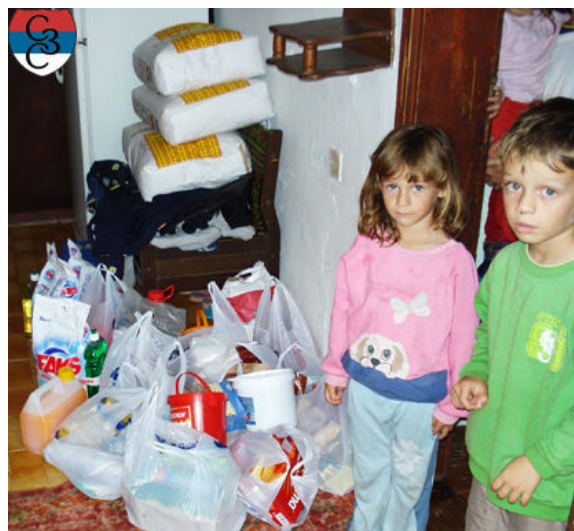
Помоћ за Торбице