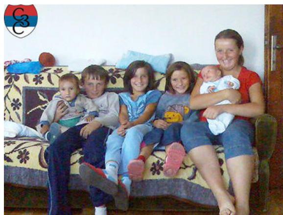
Породица Костовић, село Љулац