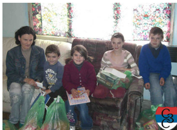
Породица Илић, село Локвари, Мањача