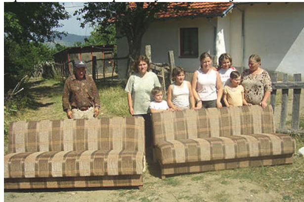
Стојановићи са новим троседима.

Пут смо наставили ка Косовској Каменици где смо направили краћу паузу у црквеном имању у самом центру града. У мору "црних орлова" приметили смо старијег српског сељака са шајкачом који немарећи за било шта слободно шета кроз центар Каменичке пијаце. Нашем