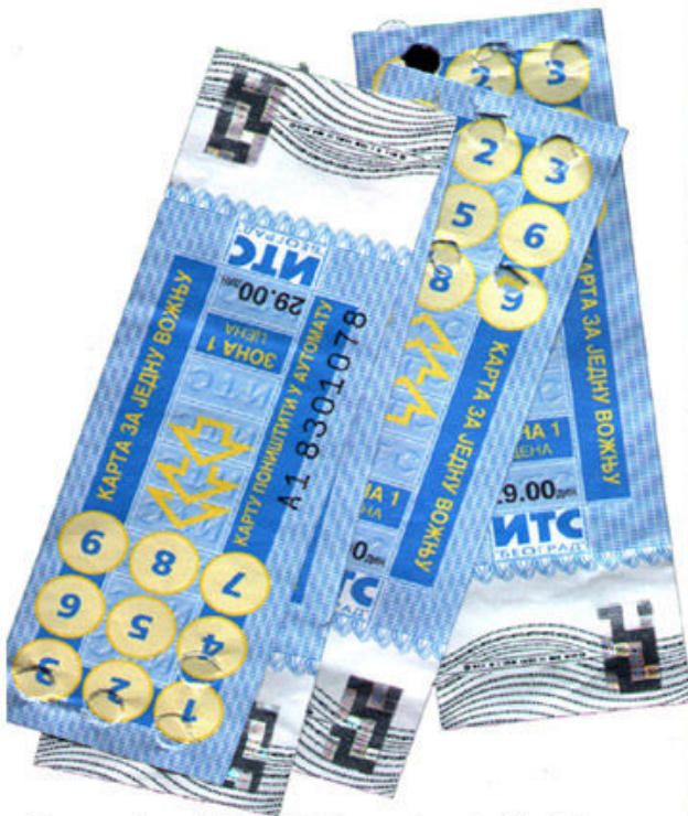
Kupovina 150 EUR na menjačnici Pinaker u Beogradu, troškovi lokalnog prevoza i telefona - ukupno 12.000 dinara